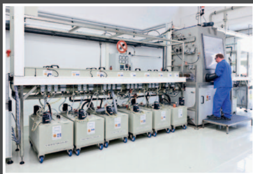
Abb. 2: Bandanlage für die Platinbeschichtung

Die Verwendung von platinieren Bändern und Drähten ging aufgrund kontinuierlicher Verbesserungen im Herstellungsprozess der Halogenlampen und in den letzten Jahren insbesondere durch disruptive Entwicklungen in der Beleuchtungstechnik in Richtung LED deutlich zurück. Mit moderner Anlagentechnik wird der weltweit konsolidierte Bedarf und der Bedarf für neue Anwendungsbereiche abgedeckt.