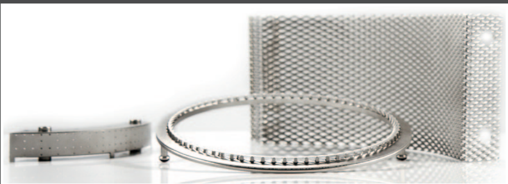
Abb. 6: Platinierte Titanbauteile für den Einsatz in der Hartverchromung, der Wafer- oder Selektivbeschichtung