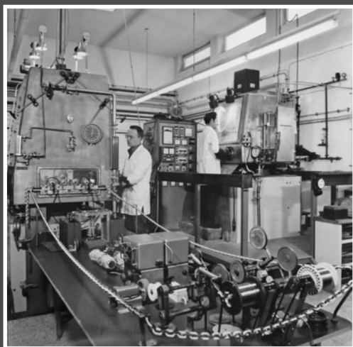
Abb. 1: Technikums- und Drahtanlage

Die erste Technikumsanlage bestand aus einem von außen beheizten Metalltiegel, der in einer „Glove-Box“ ähnlichen Einhausung betrieben wurde. Die Einhausung, gefüllt mit einem Inertgas diente zum Schutz der Schmelze vor unerwünschter Reaktion mit der Umgebungsluft. Das Fassungsvermögen des Schmelztiegels von wenigen Litern limitierte die Maximalabmessung der zu beschichtenden Produkte und deren wirtschaftliche Beschichtung. Trotzdem konnten bereits früh Anwendungen identifiziert werden, durch welche die vorhandene Anlage regelmäßig betrieben werden konnte.